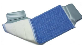
627766 wkład zapinany 40cm mikrofaza