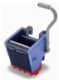
627783 uniwersalna wyciskarka doczołowa tylny odpływ wody