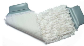
627220 wkład zapinany 40 cm 80% bawełna 20% poliester