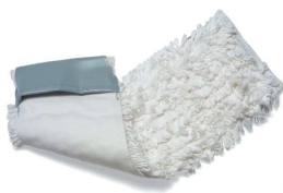
628133 wkład kieszeniowy 40 cm 80% bawełna 20% poliester