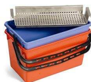
627974 BK7 zestaw: wiadra 22/22L + odsączarka