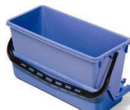
627937 AK6 dodatkowe wiadro z podstawą