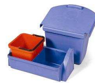
627808 AK1 zestaw: kuweta, wiaderko 5L, pojemnik na śmieci 30L