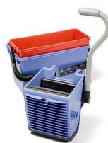
627747 BK2 zestaw: wiadra 22/15L + wyciskarka uniwersalna