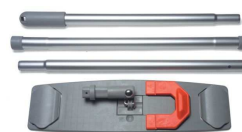
MS2 stelaż uniwersalny 40cm kij aluminiowy, składanym 135cm