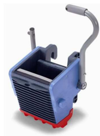
627437 ręczna i nożna wyciskarka boczny odpływ wody