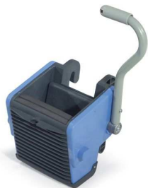
627492 uniwersalna wyciskarka doczołowa centralny odpływ wody

Wymiary (dł. szer. wys.): 1120x590x970mm