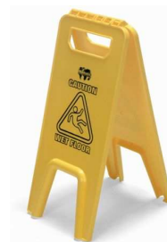
628286 stojak ostrzegawczy „UWAGA - ŚLISKA PODŁOGA”