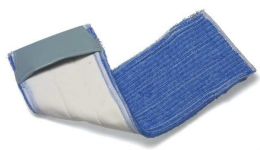
627767 wkład kieszeniowy 40cm mikrofaza