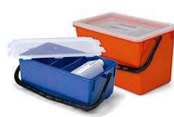
629113 BK10 zestaw MopMatic: wiadro do nasączania mopów + wiadro do przechowywania zużytych mopów