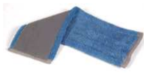
627768 wkład z rzepem 40cm mikrofaza