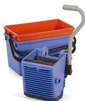
627964 BK1 zestaw: wiadra 22/22L + wyciskarka uniwersalna