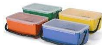
629130 Wiadro do nasączania wkładów dezynfekcyjnych