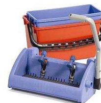
627748 BK3 zestaw: wiadra 22/15L + wyciskarka mopów do dezynfekcji